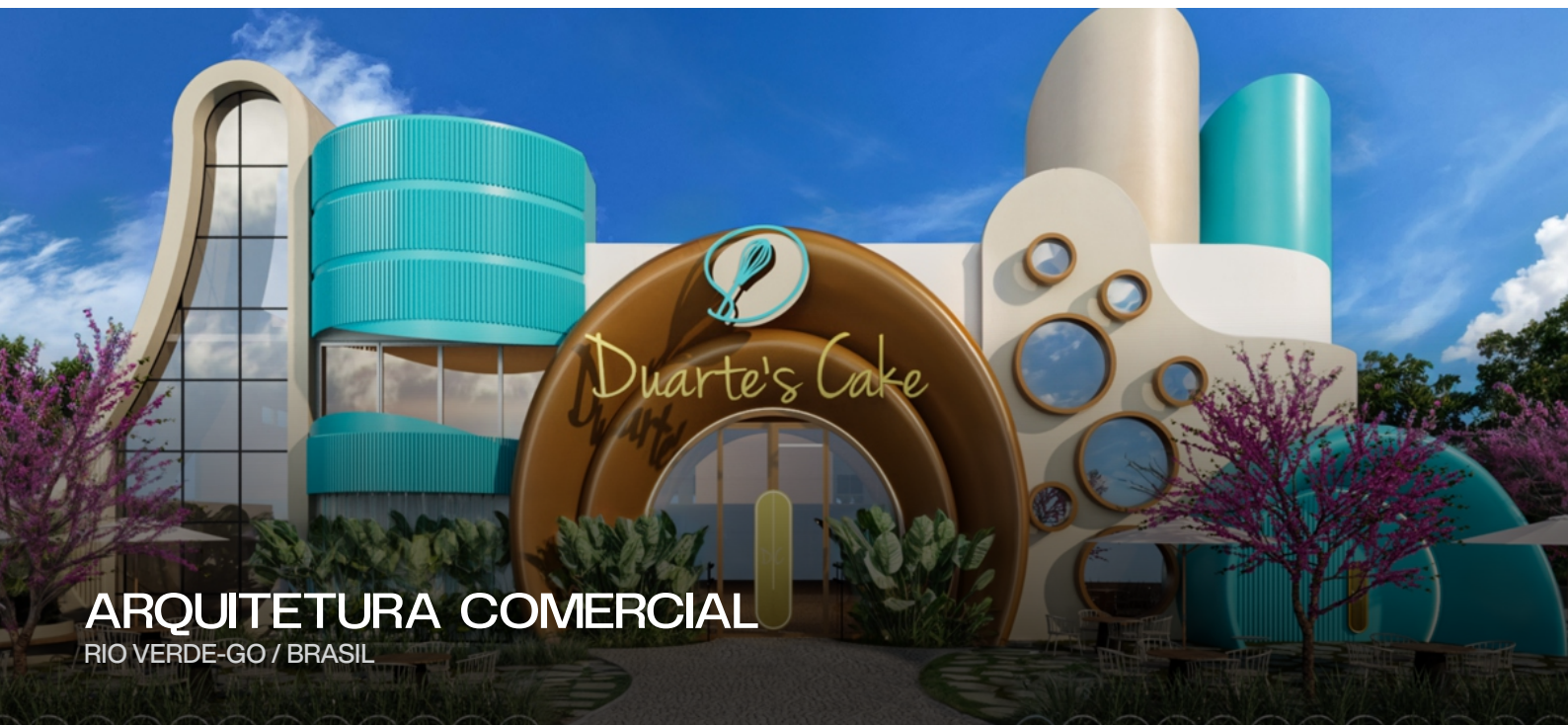
ARQUITETURA COMERCIAL RIO VERDE-GO / BRASIL