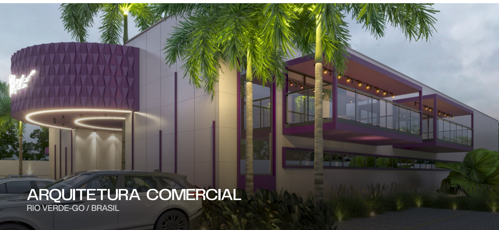
ARQUITETURA COMERCIAL RIO VERDE-GO / BRASIL