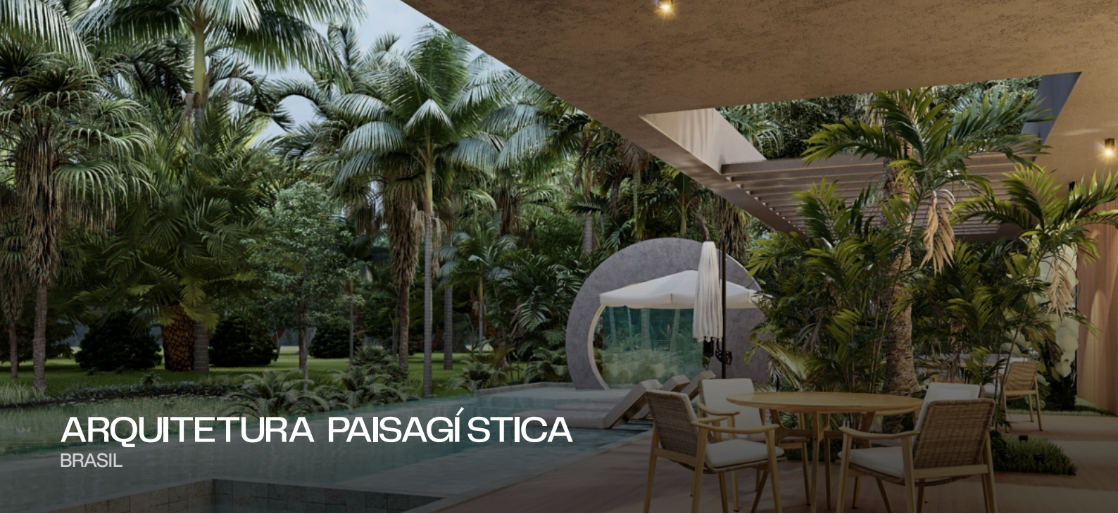
ARQUITETURA PAISAGÍSTICA BRASIL