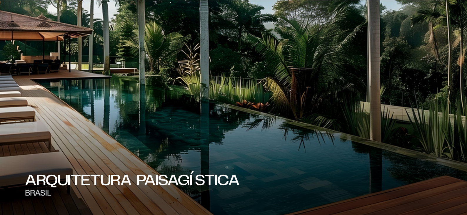
ARQUITETURA PAISAGÍSTICA BRASIL