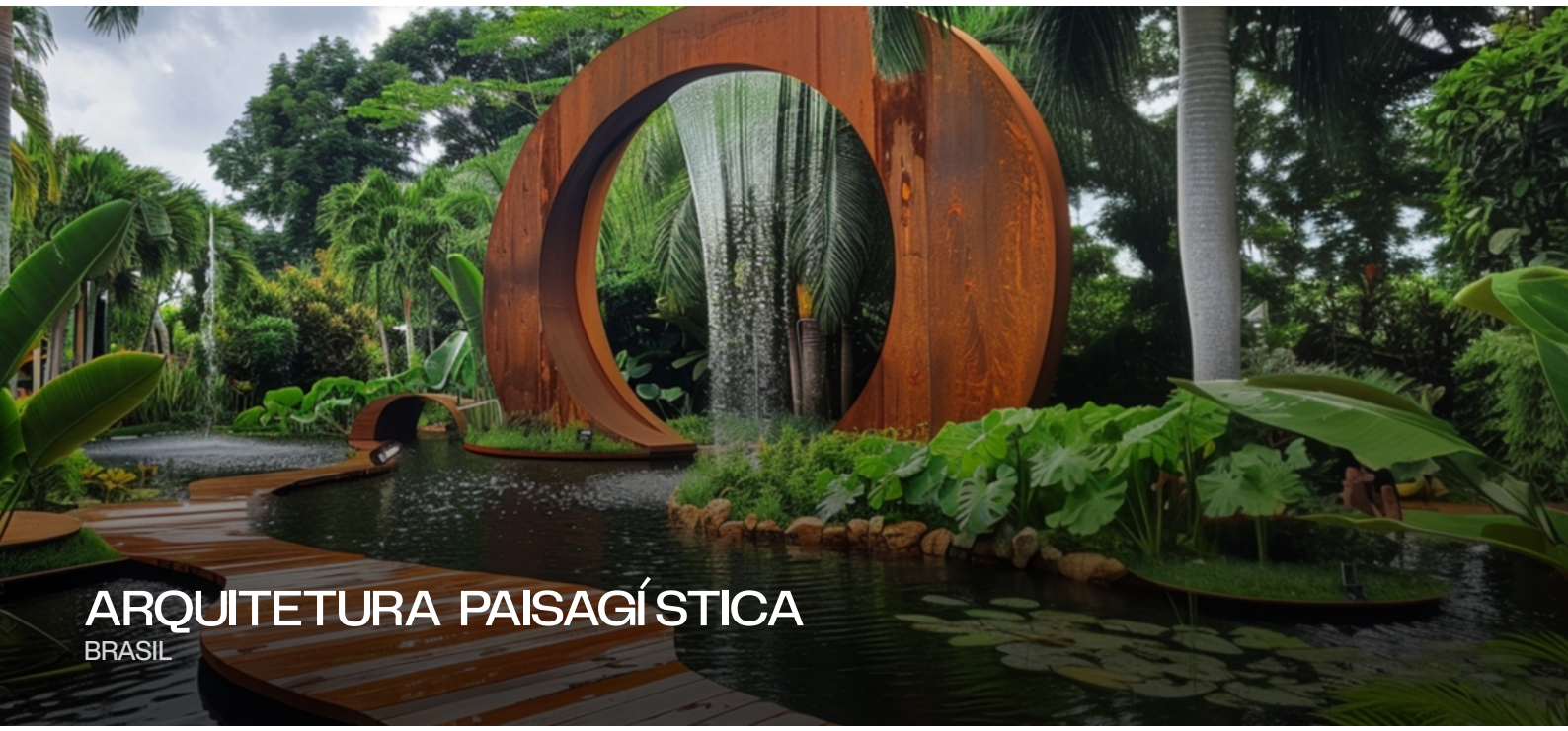
ARQUITETURA PAISAGÍSTICA BRASIL